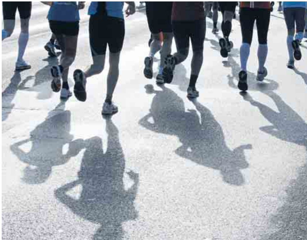
Schuhe – ein Thema mit Licht und Schatten für Langstreckenläufer.